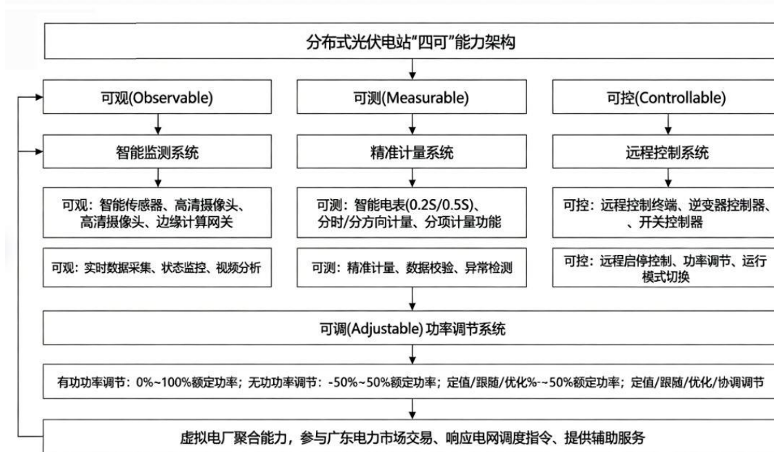
图2 "四可"能力架构图